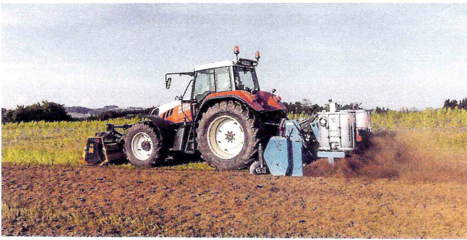
Vorn der Mulcher, hinten die Ackerfräse mit der Einspritzung von milchsäuren Pflanzenfermenten. Diese Kombination ist ideal zum flachen Einarbeiten der organischen Masse und zur Steuerung der Rotte.

winterharte Zwischenfrucht in den Untersaatbestand. Im April wird die Untersaat mit milchsäuren Pflanzenfermenten in die Flächenrotte gebracht und das Feld für die Aussaat von Sommerweizen vorbereitet.